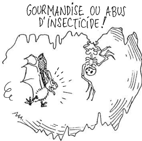
Dessin : Sandra de Pierpont d'après une idée de J.-P. Bartholeyens