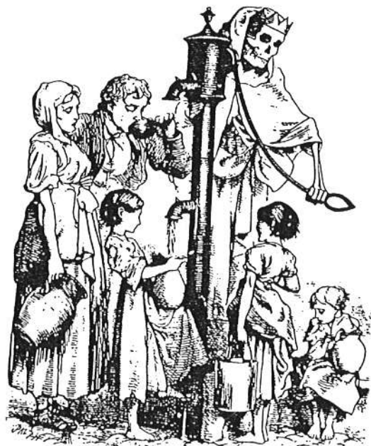
La mort à la pompe, gravure du 19ème siècle, extrait de "eaupuscule" - Pierre Hubert 1984 qui illustre l'origine de la transmission du cholera.